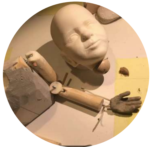
Construiremos un títere completo de hilo

Además, el curso incluye una parte de manipulación en la que los asistentes podrán aprender los principios básicos de animación. Todo el proceso de construcción está orientado a proporcionar a la marioneta de movimiento, ya que los títeres son esculturas en movimiento.